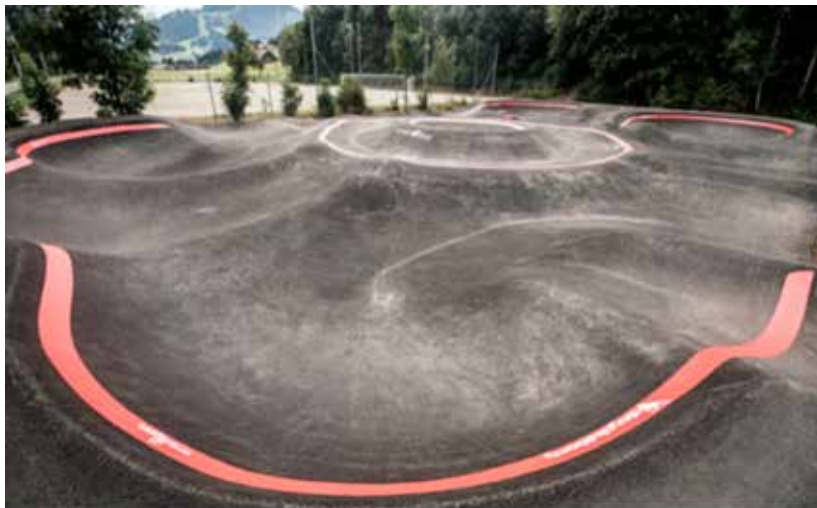
Pumptrack in Saanen

Ein Pumptrack ist nämlich eine speziell geschaffene Wellenlandschaft, welche mit Rädern aller Art befahren werden kann. Das