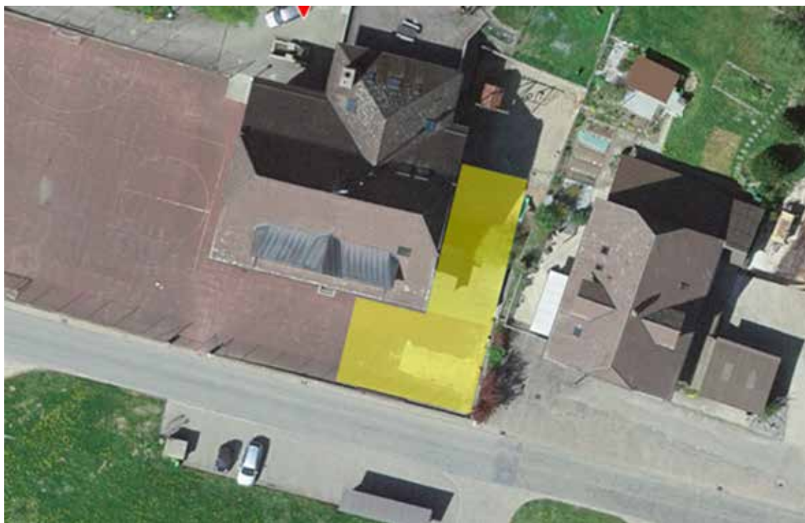
Standort und Grobplan Pumptrack Oberthal