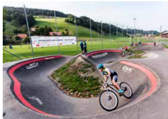
Pumptrack in Walkringen

Ziel ist es, ohne zu treten, nur durch Hoch- und Runterdrücken des Körpers (pumpen) auf der Strecke (track) Geschwindigkeit aufzubauen.